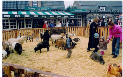
De dieren van de kinderboerderij van Piet Vos uit Heeze, waren altijd populair bij de kinderen.