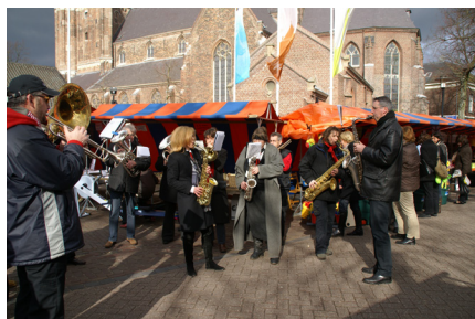
Goed Gemust zorgt voor sfeer op Lind Mert.