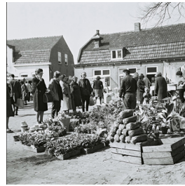
Veel voorjaarsplanten op Lind Mèrt.