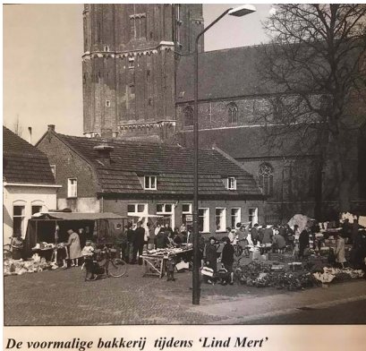
De voormalige bakkerij tijdens 'Lind Mèrt'

Op de markt o.a. bakkerijproducten (ook brokmoppen), planten, schoenen en geiten.