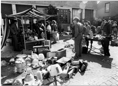
De vlooiemarkt van Jong Nederland was altijd een vast onderdeel van Lind Mèrt.